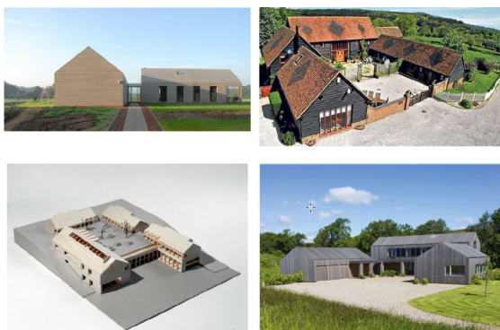
Figuur 5 voorbeelden van

Een maatschappelijke functie op de Hoogstraat 14 zien wij als kansrijk vanwege de centrale ligging, goede bereikbaarheid en reeds aanwezige parkeerfaciliteiten. We denken hier dan bijvoorbeeld aan een sportschool, tandartspraktijk, apotheek, of wellicht een kinderdagopvang.