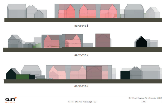
Figuur 2 studie gevelaanzicht en hoogte