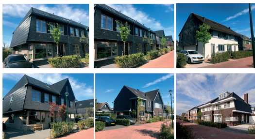
Figuur 3 referentiebeelden woningen

Ook wordt een maatschappelijke invulling mogelijk gemaakt, als alternatief op het woningprogramma.